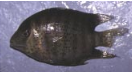
Heros sp. Dette kan være H. severus , men jeg er ikke sikker