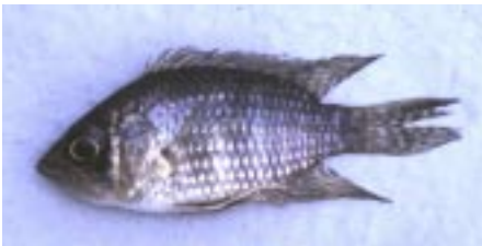
Acaronia nassa er let at kende, der findes kun to arter i slægten, den anden er A. vultuosa