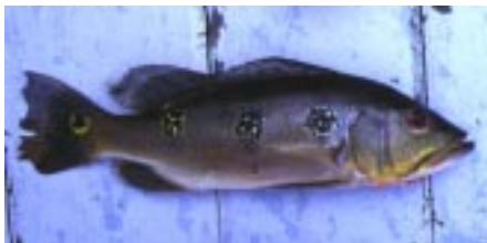
Cichla orinocensis . Ifølge Sven O. Kullander er de fleste fisk der er fanget og identificeret som C. ocellaris , uden for Guyana, i virkeligheden nok C. orinocensis , alle Cichla arter er utrolige fightere

Cichla orinocensis , Cichla temensis , Cichla monoculus , Crenicichla marmorata , Crenicichla sp., Geophagus sp., Heros severus , Acaronia nassa , Mesonauta festivus , flere arter af pirat fisk, arowanaer, knivfisk, diverse maller og mange tetra arter, der i blandt rov tetraen Hoplias malabaricus , der absolut ikke ligner en tetra. Den mest spændene fangst var afgjort et par kæmpe store feskvands pigrokker.