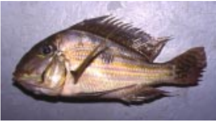
Geophagus sp. Der er stor lighed mellem arterne i denne slægt, så det er temmelig svært at sige hvilken art det er, ud over at den er fra Anavilhanas Islands