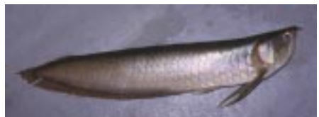
Denne halv meter lange Arowana hoppede op i båden, til stor forbløvelse for passagererne