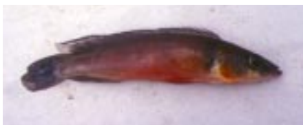
Denne Crenicichla sp. Har jeg ikke kunnet identificere. Det er uden tvivl en hun, der kan kendes på det hvide bånd i rygfinnen og den røde