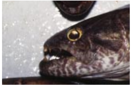
Hoplias malabaricus er faktisk en tetra, selv om man ikke skulle tro det, det er i øvrigt en fantastisk fighter, der er meget sjov at fange på let grej