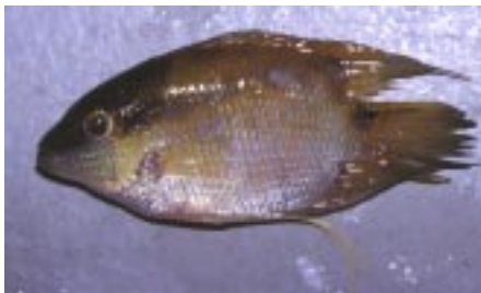
Mesonauta species fra Anavilhanas Islands er en uidentificeret flagcichlide