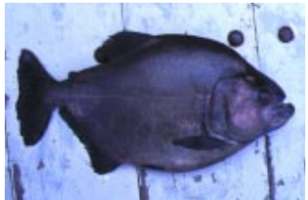
Serrasalmus niger er en af de største piratfisk der findes, den knuser let en spindel til ukende lighed