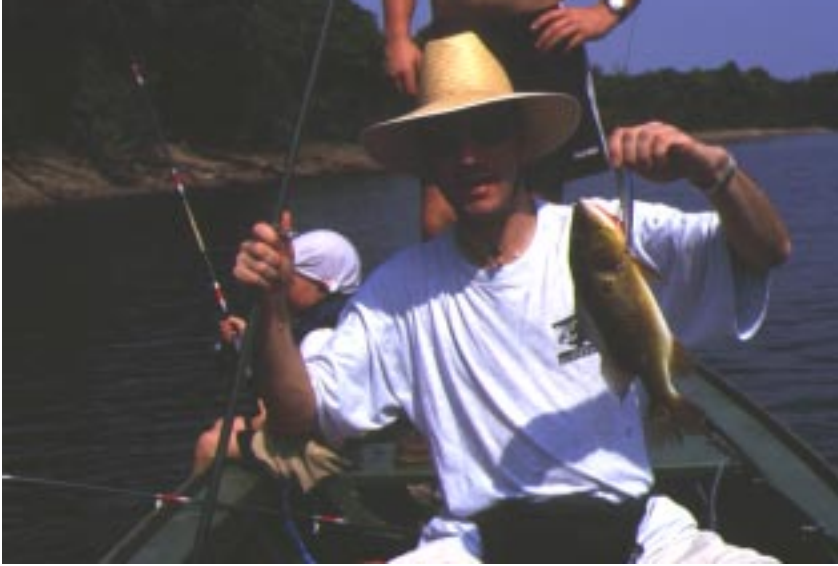
I Amazonas kan man virkelig fange nogle spændene fisk, her en Cichla orinocensis

Et mål for de fleste akvariefolk er vel på et eller andet tidspunkt, at komme til akvariefiskenes hjemland. Dette hjemland er uden tvivl Amazonas i Brasilien.