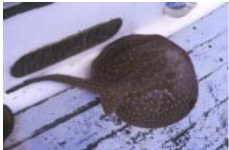
En næsten meter lang ferskvands pigrokke