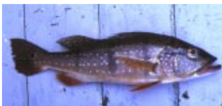
Cichla temensis , kan kendes på de små lyse pletter på langs af kroppen