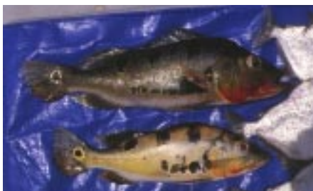
Cichla monoculus , kan kendes på de tre mørke pletter på ryggen og de store langsgående pletter på bugen. Der findes to former, øverst den mørke og nedst den lyse form, de har desuden kraftigt røde gællelåg